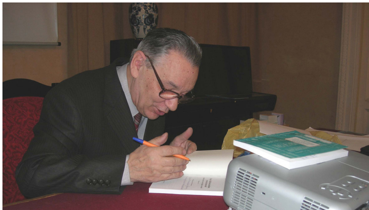
Презентация нового выпуска «Опыта библиографии отечественной генеалогии» (Ч. 4–6, 2008)