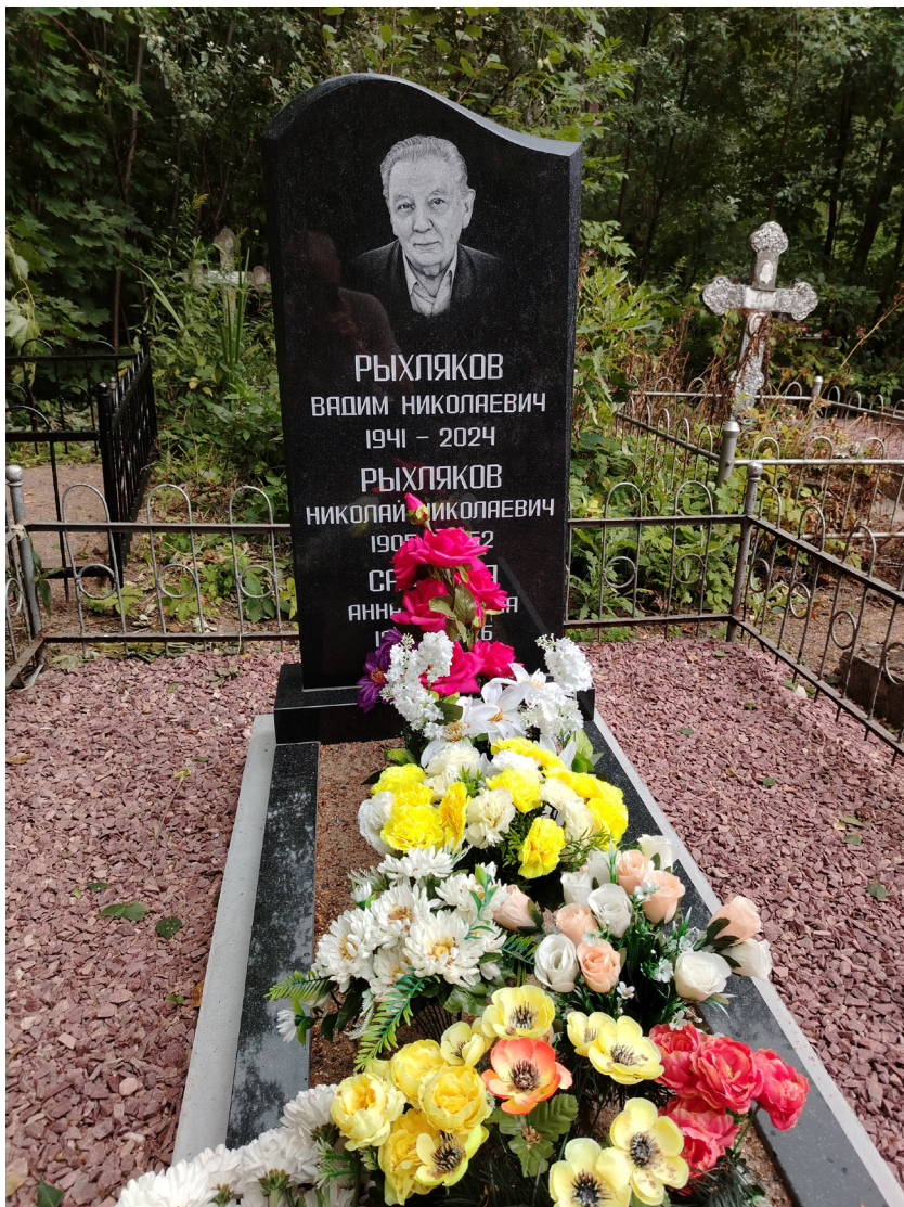
Семейная могила Рухляковых на Ново-Волковском кладбище, Санкт-Петербург