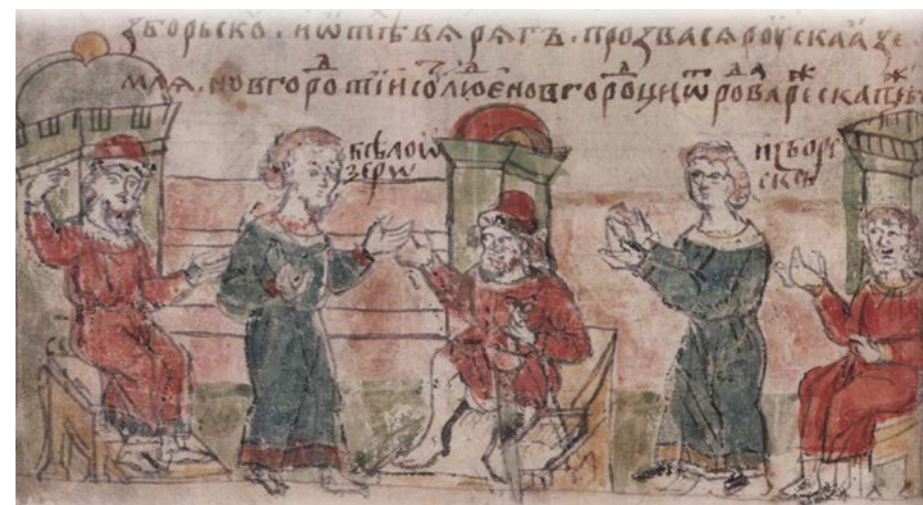
«Призвание варягов», миниатюра из Радзивилловской летописи, XV век

Считается, что род человеческий по мужской линии происходит от некоего Адама, который жил 200–300 тыс. лет назад. То есть из всех первых мужчин, которые появились на территории Африки, только один оставил прямое потомство. Его принято называть Y-хромосомный Адам. Каждые несколько поколений в Y-хромосоме происходят мутации. Они накапливаются, образуя новые генетические ответвления. Наиболее древние из них – это основные гаплогруппы, самые мощные ветви древа человечества. От них выделяются веточки поменьше. Чтобы определить родство, достаточно установить принадлежность к одной гаплогруппе, то есть набору неких генетических признаков. Скажем, Рюриковичи (то есть Вяземские, Лобановы-Ростовские, Кро-