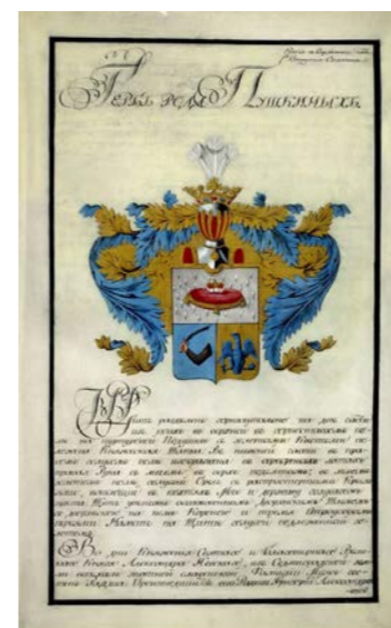
Герб рода Пушкиных. Источник: Государственный музей А. С. Пушкина в Москве

Все между собой как-то пересекались, не только через древних предков. Тема, с которой я начал генеалогическую работу, называлась «Родственные связи и окружение декабристов». Все они были дворяне и состояли между собой в родстве. Наша аристократия, как правило, сохраняла определенный уровень браков.