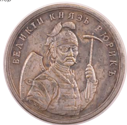
Серебряная монета-медаль «Великий князь Рюрик». Гравёр: Г. Х. Вехтер

дается по прямой мужской линии, ученые смогли устанавливать родственные связи семей на много-много веков и даже тысячелетий назад. Благодаря накопленной базе данных стало возможным изучение, например, генеалогии Рюриковичей. Как это делается? С одной стороны, появились методы генетического анализа костных останков. Но это сложно. А самое простое – ДНК-тесты. Скажем, есть два человека, предок которых, по родословным, жил в XII веке. Сравниваем их гены – и действительно подтверждается, что такой человек существовал, причем именно в то время. Я сам делал тест: мои предки были балтами. Это та же самая гаплогруппа, что у Гедиминовичей и Рюриковичей, но мы с ними давно разошлись.